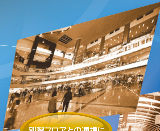
別階フロアとの連携に