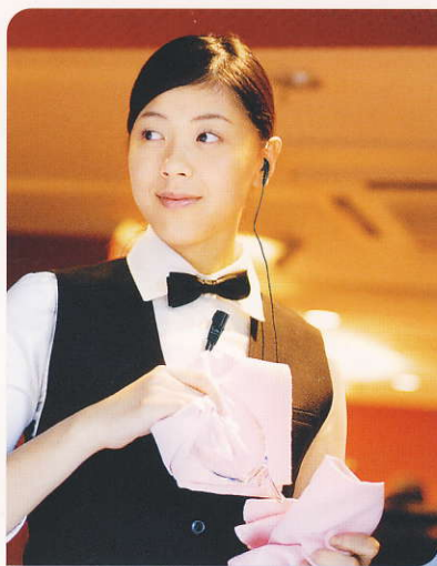
結婚式の円滑な進行に コンパクトなボディなので スタッフの機動力を損ないません。