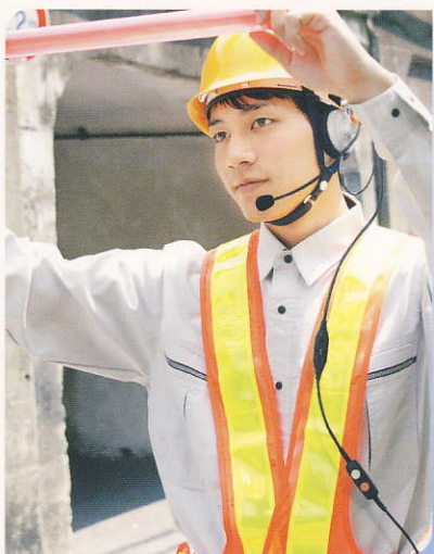
交通整理の連絡に 車の騒音や雨の中でも、 快適なコミュニケーションを実現します。