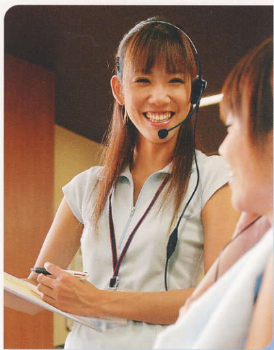
フィットネスクラブでのスタッフ間の連絡に プールなど水や汗に触れる環境でも 気にせず携帯できます。