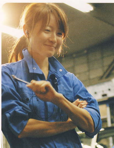
整備士と営業スタッフ間の連絡に 軽量・堅牢なので、身につけていることを 気にせず作業や商談を進めることができます。