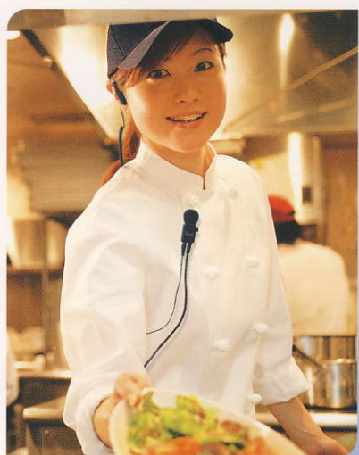
厨房とホールスタッフの連携に 水や蒸気にさらされる厨房でも 安心して使用できます。