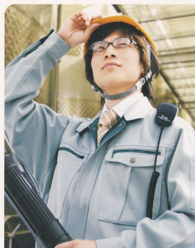
工場での指示や報告に 機械の騒音が大きい工場内でも 本体の振動で着信を確認できます。