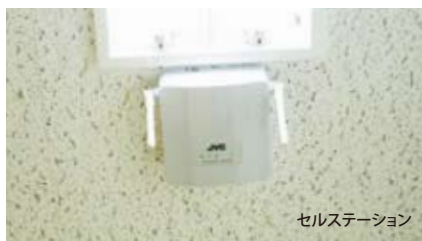
セルステーション