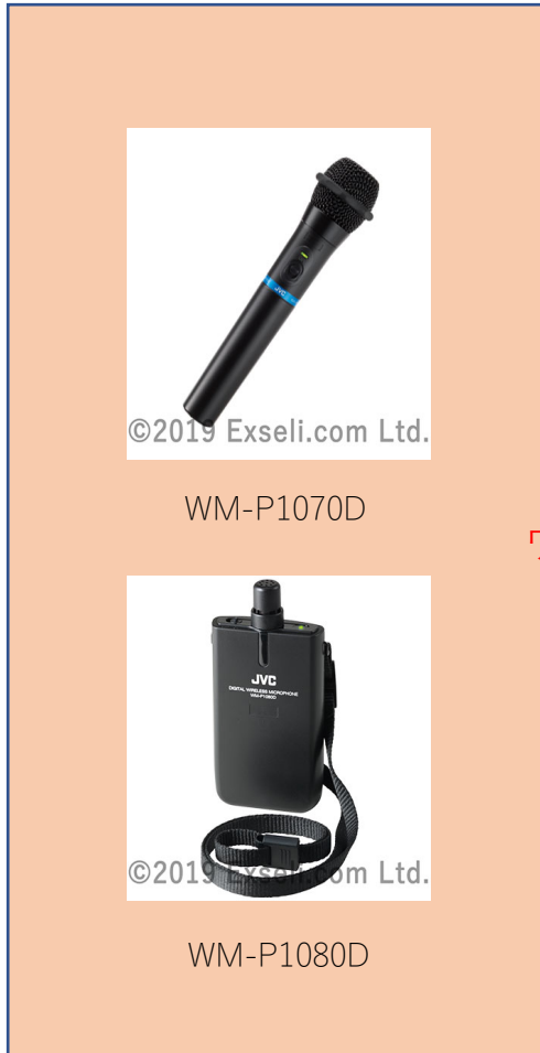
ワイヤレスマイクロホン