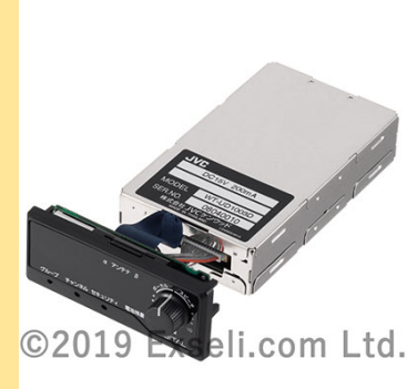
デジタルワイヤレスマイクロホン WM-P1080D(ペンダント型)