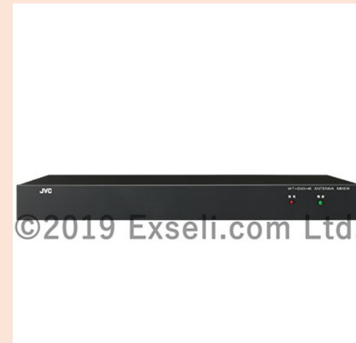
アンテナミキサー WT-D88-B

デジタルワイヤレスチューナーWT-1002D、WT-1004Dの多チャンネル対応によるエリア拡張をより簡単に行うことが出来るようになる800MHzダイバシティアンテナ混合分配器です。