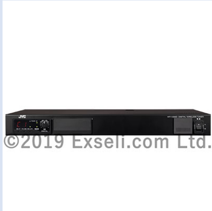
デジタルワイヤレスチューナー(最大2波対応) WT-1002D