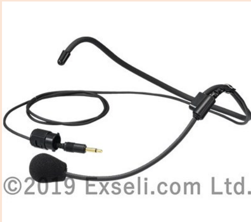
ヘッドセットマイク WT-UM82