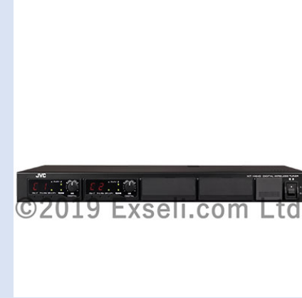
デジタルワイヤレスチューナー(最大4波対応) WT-1004D