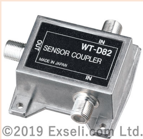
センサーカプラー WT-D82

ワイヤレスチューナーを3台以上組み合わせて使用する際に、アンテナミキサーから受け取る信号を分配・混合してワイヤレスチューナーに送出するアンテナ分配器です。