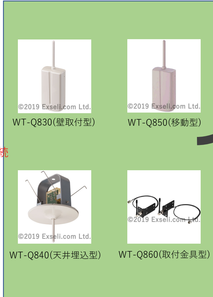
ワイヤレスアンテナ