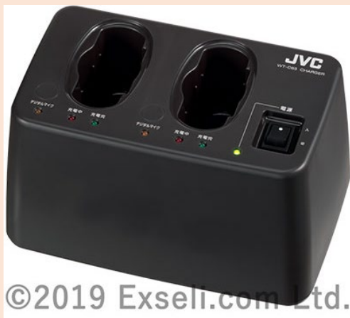
ツインチャージャー WT-C63