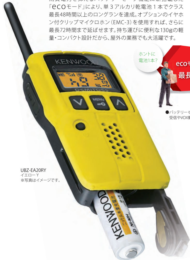
UBZ-EA20RY イエロー-Y ※写真はイメージです。

●バッテリーセーブ「ON」または「ECOモード」設定時は、消費電力を抑える動作を繰り返しているため、受信やVOX動作時の音声の始めが途切れる場合があります。(出荷時は「バッテリーセーブ「ON」」設定です)