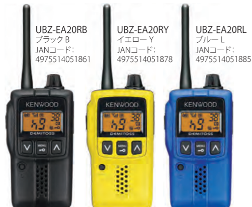
UBZ-EA20RB ブラックB JANコード: 4975514051861