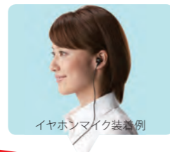
イヤホンマイク装着例

消費電力を抑えるバッテリーセーブ機能に新搭載した「ECOモード」により、単3アルカリ乾電池1本でクラス最長48時間以上のロングランを達成。オプションのイヤホン付クリップマイクロホン(EMC-3)を使用すれば、さらに最長72時間まで延ばせます。持ち運びに便利な130gの軽量・コンパクト設計だから、屋外の業務でも大活躍です。