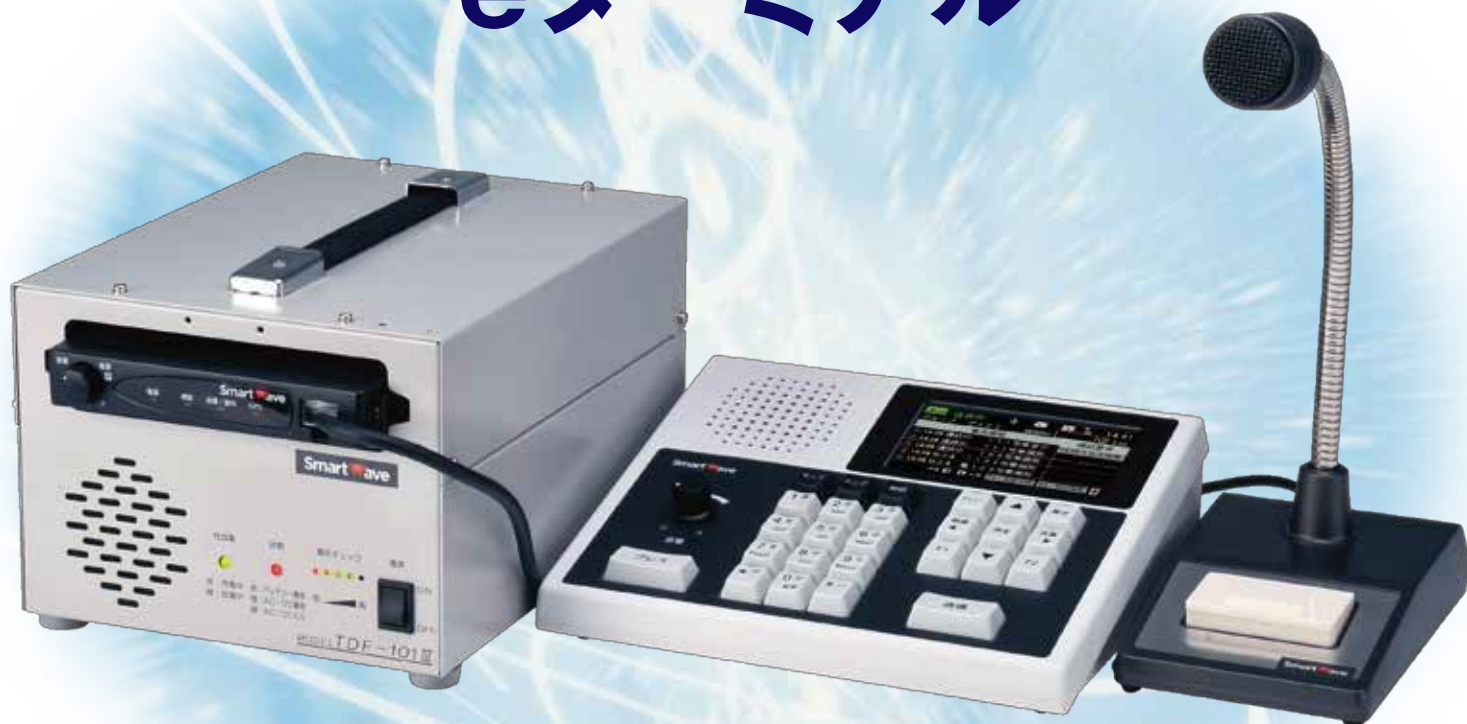
スタンドアロン運用時機器一覧