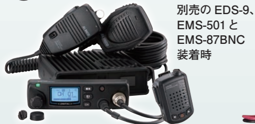
別売の EDS-9、EMS-501 と EMS-87BNC 装着時