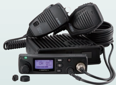
別売の EDS-9 と EMS-501 装着時