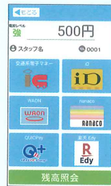
電子マネー選択画面