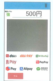
コード決済画面(カメラ)