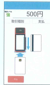
クレジット決済画面

モバイル端末のため、さまざまなシチュエーションで決済が可能。操作画面もボタンが大きく見やすくなっており、音声案内で簡単に操作ができます。