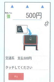
電子マネー決済画面