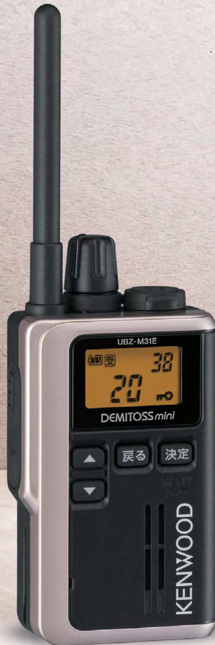
《実物大》 UBZ-M31E G