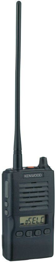
TCP-523 UHF帯 簡易無線電話装置 (小エリア簡易無線)