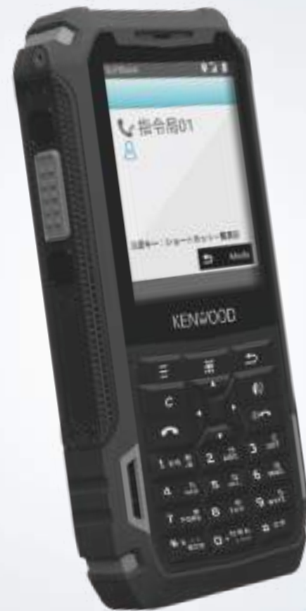
801KW by KENWOOD

ウェブブラウザや静止画・動画を共有できるチャットをはじめとする、ビジネスに役立つインターネットサービスにも対応予定です。