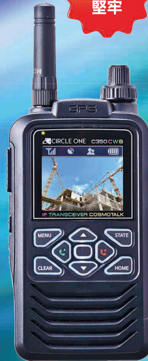
カラーハンディ・コスモトーク C350-CWB