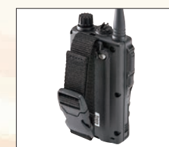
付属品【子機】 EBC-50 ハンドストラップ

EBC-50は通常のベルト以外にも安全ベストのひもやツールベルトなど、幅8cmまで対応します。さらに、スイングすることで、腰に下げた時の違和感を無くし、ストレスが掛かりやすいアンテナやイヤホンジャックへの負担を軽減でき、子機の落下も防止します。