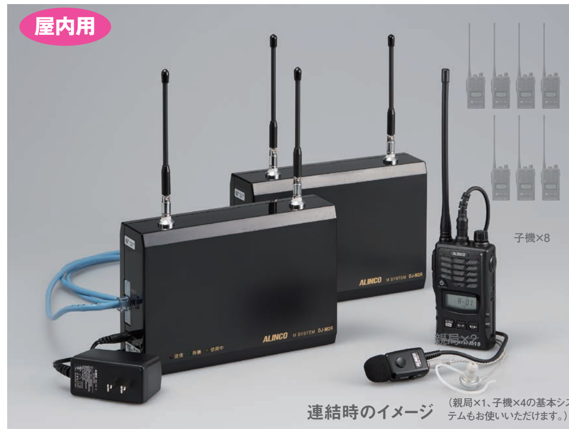
連結時のイメージ (親局×1、子機×4の基本システムもお使いいただけます。)