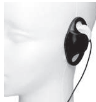
BM-GSRE3.5 D型 イヤホン3.5mm