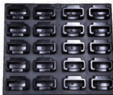
BM-DAC20 専用充電器20台用(ケース無)

株式会社エクセリ 東京都中央区日本橋浜町2-30-1 / 大阪府大阪市中央区久太郎町1-9-5 お問い合わせ総合ダイヤル 03-3662-0551 URL: https://www.exseli.com/