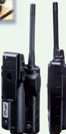
付属品 ●ハンドストラップ ●ベルトクリップ 形状は上の写真をご覧ください。