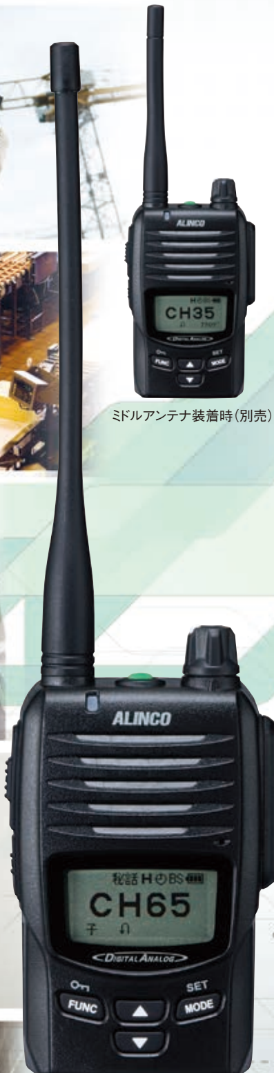
ミドルアンテナ装着時 (別売)