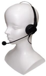
標準型ヘッドホンマイク