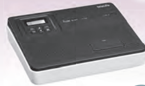
インターフェースボックス VE-SP2 同報通話 対応

外形寸法: 約 216.8 (W)× 173.3 (D)× 52.8 (H)mm (突起物を除く)