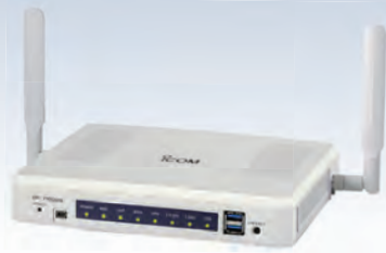
ワイヤレスアクセスポイント SR-7100VN