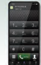
スマートフォンアプリ AGEphone