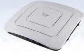
ワイヤレスアクセスポイント AP-9500

IEEE802.11ac 準拠、 2.4GHz帯と5GHz帯の同時通信に 対応した高性能アクセスポイント。