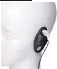
専用イヤホン BM-GSRE2.5 D型イヤホン2.5mm