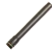
B-X10anl X10 アンテナ ロング