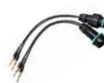
B-RCLwptn 中継接続ケーブル コネクターX10用防水仕様