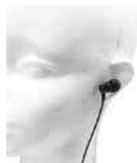
専用イヤホン BM-SHSE2.5 小型高速音性イヤホン2.5mm