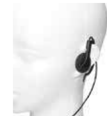
専用イヤホン BM-GSRM2.5 耳掛け式イヤホン2.5mm