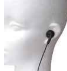
専用イヤホン BM-LCOE2.5 オープンエアイヤホン2.5mm