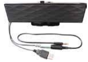
B-A07 スピーカー クリップ付