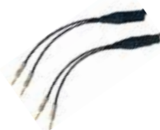
B-RCLtn 中継接続ケーブル コネクター X10用