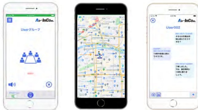
会議室 位置確認機能 メッセージ

Apple, App Store, iPhoneは米国および他の国々で登録されたApple Inc. の商標です。