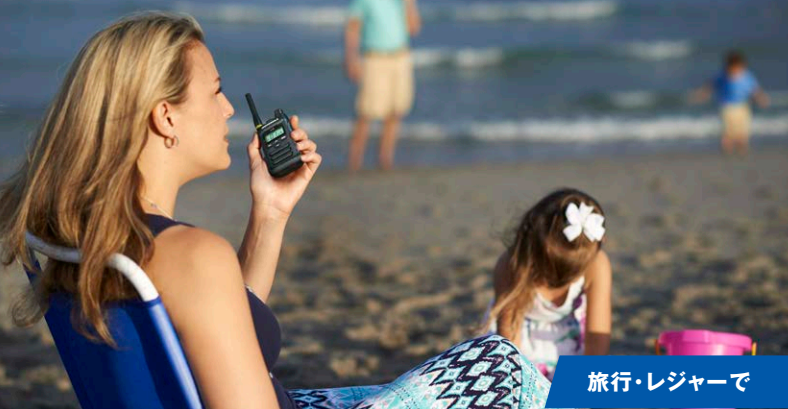
旅行・レジャーで