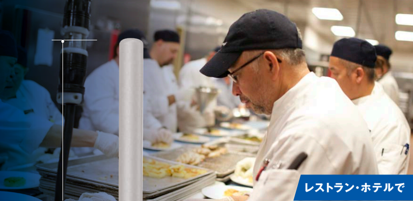
レストラン・ホテルで