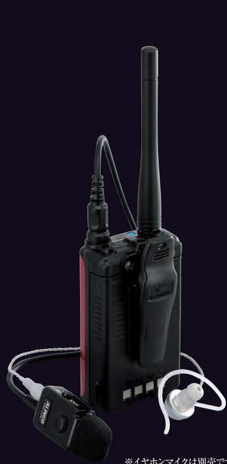
※イヤホンマイクは別売です。