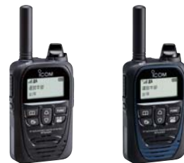
LTEトランスシーバー IP500H PoCトランスシーバー IP501H