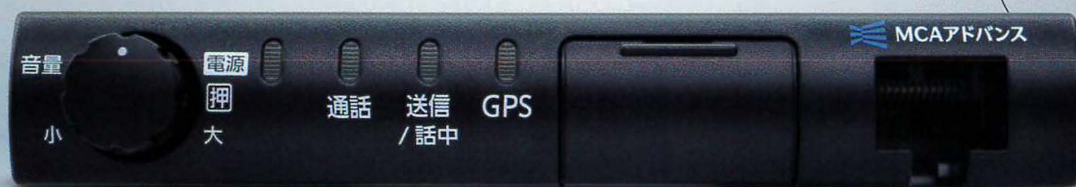
MCAアドバンス車載機 TEF-6T705A