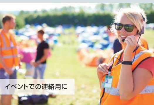
イベントでの連絡用に