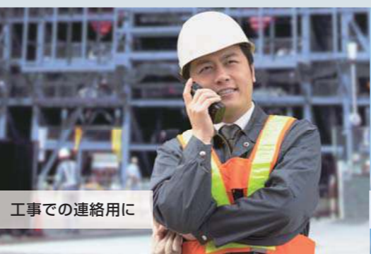
工事での連絡用に