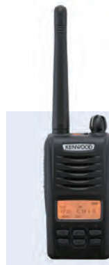
デジタル簡易無線 携帯型登録局対応無線機 D503シリーズ