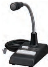
ベース用 スタンドマイクロホン KMC-53