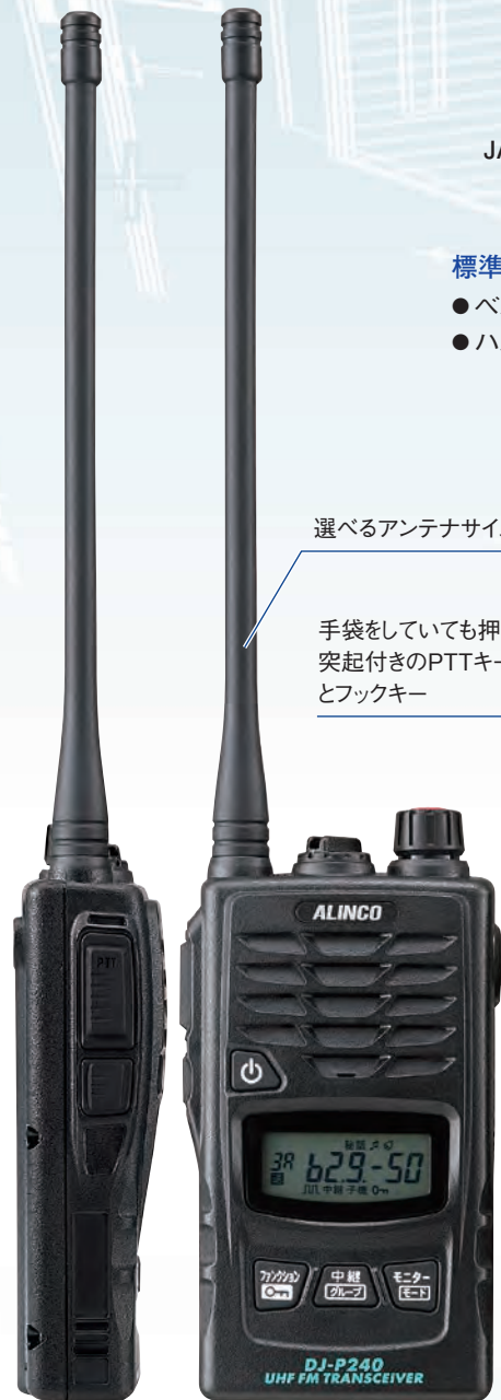
選ぶアンテナサイズ

普通の連絡には加わらない、でも「事務所に来て！」「作業の進捗状況は？」といった呼び出しはしたい…そんな時に便利な2波同時受信。通話中でも相手と割り込み側の両方が聞こえ、サブPTTを押せば割り込み側との通話ができます。さらにワイヤレスコールと組み合わせて使えばDJ-P240同士で通話中でもコール音声も聞こえるので聞き漏らしがなくなります。