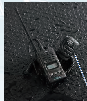
マイクユニットもIP67の耐塵防浸、別売スピーカーマイク、EMS-71