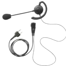
ブームマイクイヤホン JSPRN0003 本体価格 4,800円(税抜)