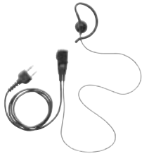
小型タイピンマイク&イヤホン JSPRN0001 本体価格 3,800円(税抜)