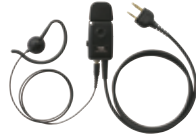
タイピンマイク&イヤホン (マイク感度切替え付) JSPRN0002 本体価格 6,000円(税抜)