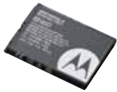
リチウムイオン電池パック (930mAh) BN60 本体価格 3,000円(税抜)