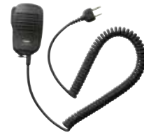
スピーカーマイク JSPMN0001 本体価格 3,600円(税抜)