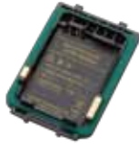
リチウムイオン電池ケース JCPLN0002 本体価格 1,400円(税抜)