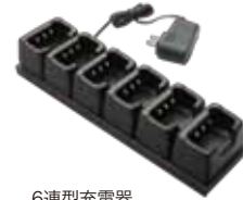
6連型充電器 (ACアダプター付) JCPCN0004 本体価格 18,000円(税抜)