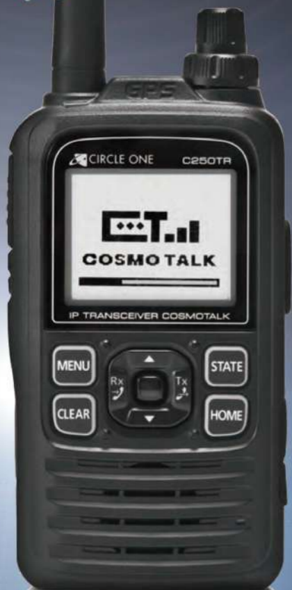
ハンディ・コスモトーク C250TR