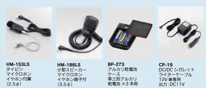
HM-153LS タイピン マイクロホン イヤホン付属 (2.5φ)