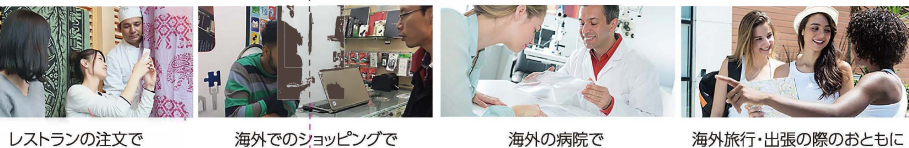
レストランの注文で 海外でのショッピングで 海外の病院で 海外旅行・出張の際のおともに

こんな場面で大活躍 32ヶ国語対応だから、 多彩な外国人と Let's Communicate!!