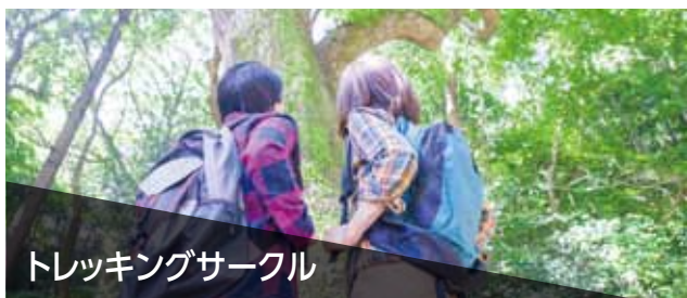
トレッキングサークル

携帯電話の電波が届かないエリアに行くこともあり、無線機の購入を検討。シニア層も多く、誰もが簡単に操作できる機器が欲しい。