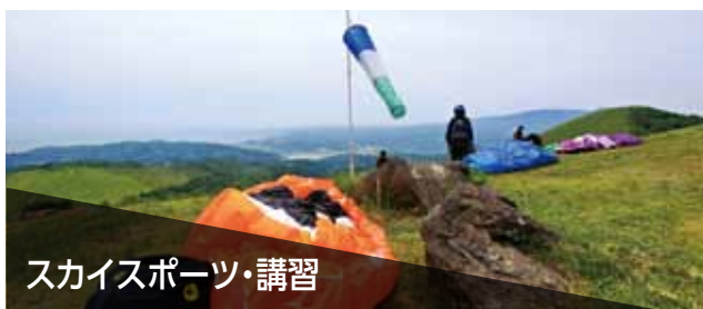
スカイスポーツ・講習

パラグライダーの教習施設にて。教官が地上から上空の受講生に指示できる、簡便な無線機器が欲しい。