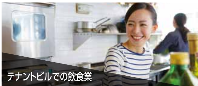
テナントビルでの飲食業

女性従業員に配慮し、コンパクトサイズの特定小電力トランシーバーを使ってきたが、電波が届きにくく、外部からの混信も。