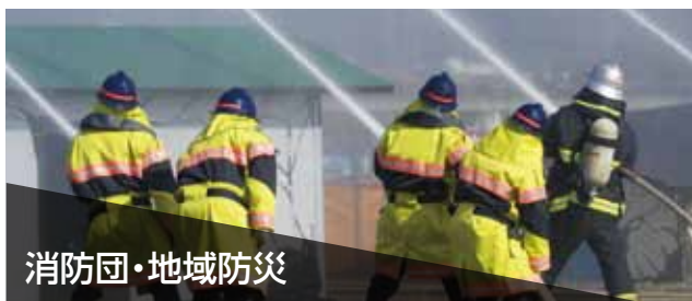
消防団・地域防災