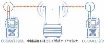
CL70A/CL120A 中継装置を経由して通話エリアを拡大 CL70A/CL120A