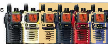
ブラック シルバー イエロー ネイビー レッド ブルー