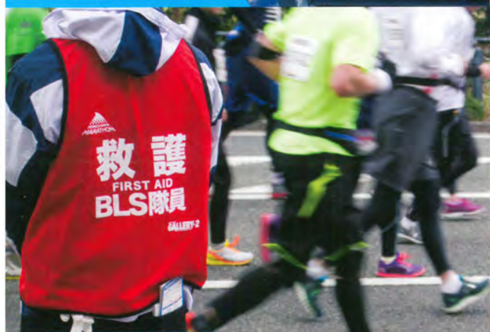
スポーツイベント