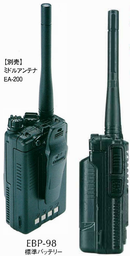
【別売】 ミドルアンテナ EA-200