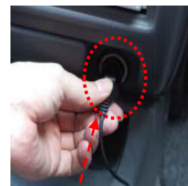
電源はシガーソケットから取ります