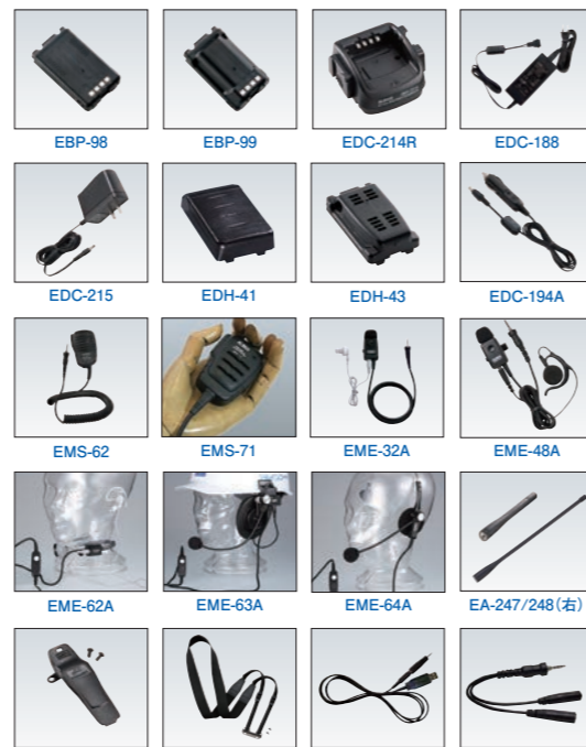
※アクセサリに無線機、ヘルメットなどの小物は付属しません。