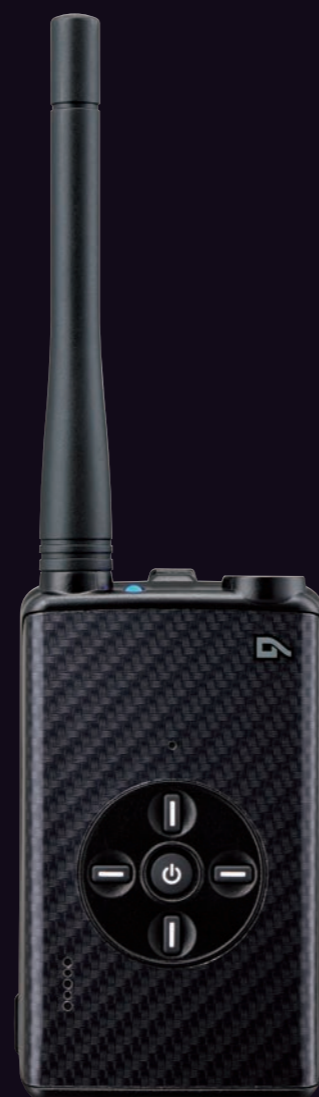
Carbon Black DJ-DPX1KA