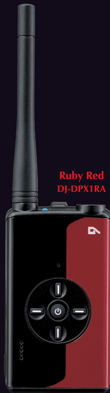
Ruby Red DJ-DPX1RA