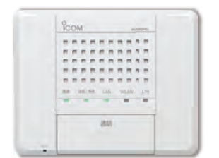
無線IPインターコム IP200PG