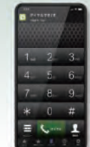
スマートフォンアプリ AGEphone