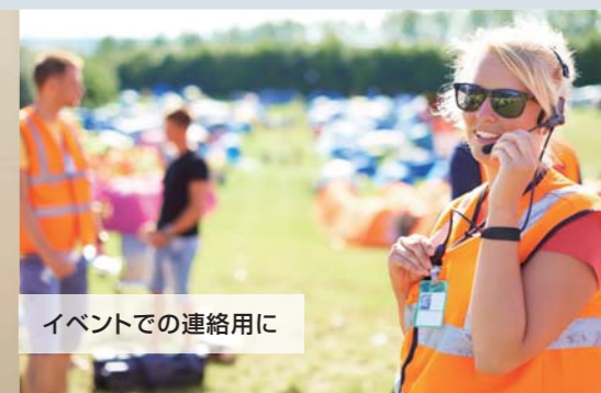
イベントでの連絡用に