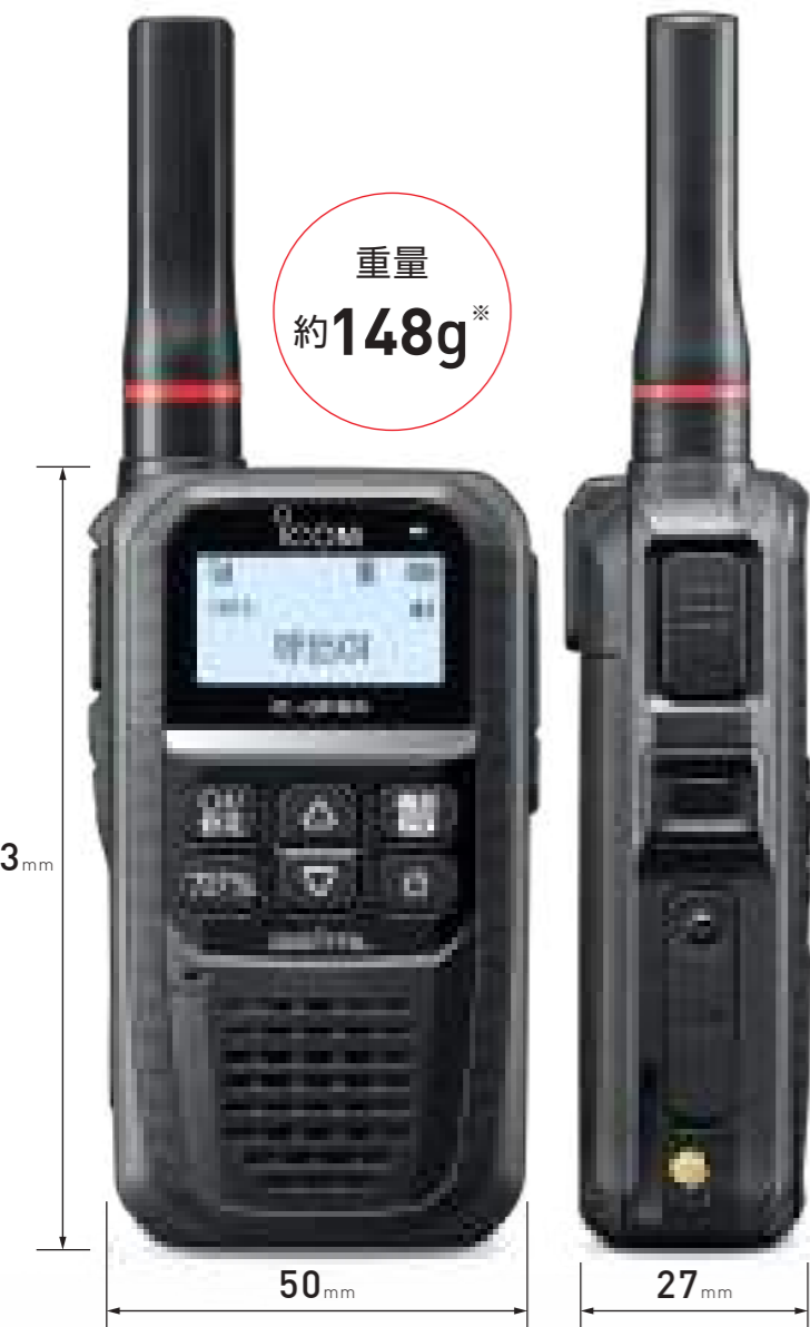
原寸大 ※付属バッテリーパック装着時。