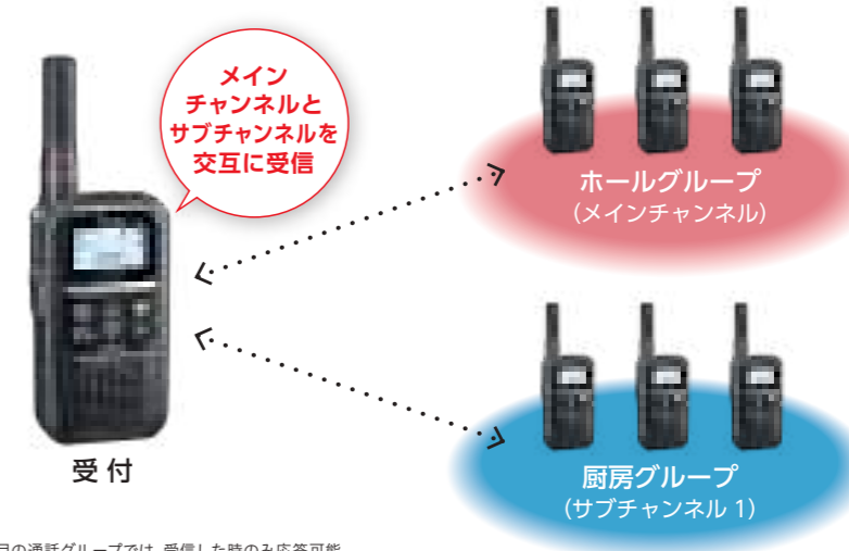
※3つ目の通話グループでは、受信した時のみ応答可能。