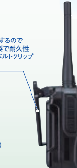
② 標準のアンテナとバッテリーパック (EBP-82) ③ オプションのロングアンテナと大容量バッテリーパック (EBP-89)

2ヶ所でネジ止めするので外れにくく、金属製で耐久性に優れたバネ式ベルトクリップ EBC-27