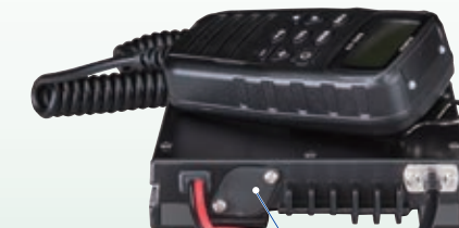
電源ケーブル スピーカージャック(防水フタ付き) アンテナ端子(M型)

2ヶ所でネジ止めするので外れにくく、金属製で耐久性に優れたバネ式ベルトクリップ EBC-27