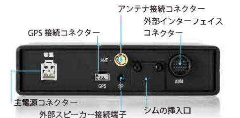
【COSMO TALK 背面】