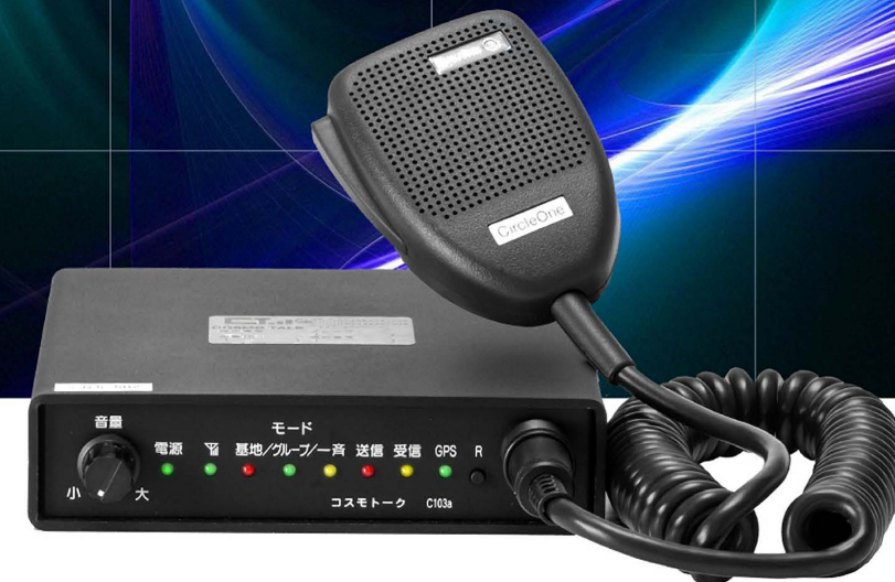
COSMO TALK C103a