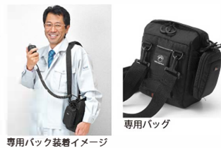
バッテリー内蔵 可搬型コスモトークC103p 充電容量が一目で判断可能な色別表示

3時間でフル充電。 待ち受け状態にて 8～10時間通話可能。 総重量が2kgと軽量。