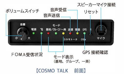
【COSMO TALK 前面】