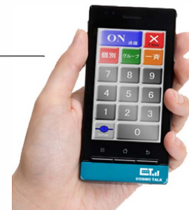
スマートフォンによるコスモトーク C103h