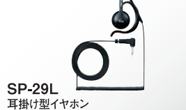
SP-29L 耳掛け型イヤホン 2,000円＋税 JANコード：4909723009955