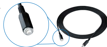
OPC-1856 リモートケーブル(約3m) 2,000円＋税 JANコード：4909723009306

●商品の技術的なお問い合わせは(平日9:00～17:00)フリーダイヤル：0120-156-313、携帯電話・PHS・公衆電話からは：06-6792-4949、その他のお問い合わせは最寄りの営業所までご連絡ください。