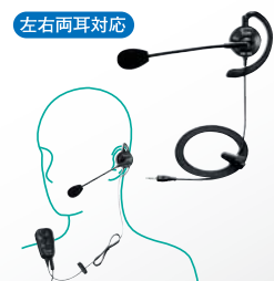
HS-99 ※VS-2Lが必要 耳掛け型イヤホンマイクロホン 4,000円＋税 JANコード：4909723009375