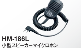
HM-186L 小型スピーカーマイクロホン 3,800円＋税 JANコード：4909723009597