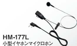
HM-177L 小型イヤホンマイクロホン 3,800円＋税 JANコード：4909723007012