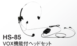
HS-85 VOX機能付ヘッドセット 7,500円＋税 JANコード：4909723803805