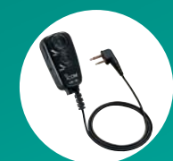
VS-2L PTT／VOXスイッチユニット 3,500円＋税 JANコード：4909723009351