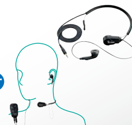
HS-97 ※VS-2Lが必要 咽喉マイクロホン 2,300円＋税 JANコード：4909723810926