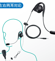
HS-94 ※VS-2Lが必要 イヤークック型ヘッドセット 1,500円＋税 JANコード：4909723809920