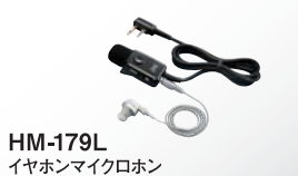
HM-179L イヤホンマイクロホン 6,500円＋税 JANコード：4909723007029