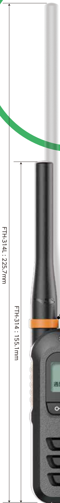
原寸大 (バックはロング アンテナモデル)

本製品はオーディオコネクタのキャップを開めた状態でIP67となり、それ以外の場合IP65となります。