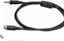
SCU-11 PTTケーブル 本体価格3,000円(税抜)