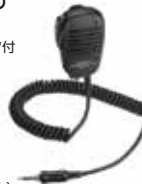
MH-57A4B スピーカーマイク 本体価格4,700円(税抜)