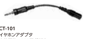
CT-101 イヤホンアダプタ 本体価格1,300円(税抜)