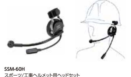
SSM-60H スポーツ/工事ヘルメット用ヘッドセット 本体価格13,200円(税抜)

ヘルメットに装着するタイプのヘッドセット ※本体との接続にはSCU-11が必要です。