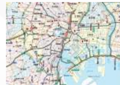
PM-IP500による位置情報表示例。 （地図使用承認©昭文社第61G319号）