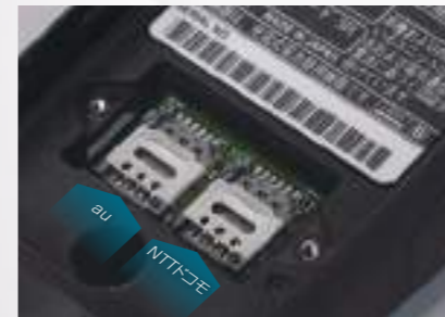
SIMスロットを2つ装備し、本体で切り替え可能。

au回線とNTTドコモ回線の2枚のSIMを同時に装着可能。本体操作だけで2回線を切り替えて使えます。両回線のSIMを装着しておくことで、万一回線トラブルにも対応できます。