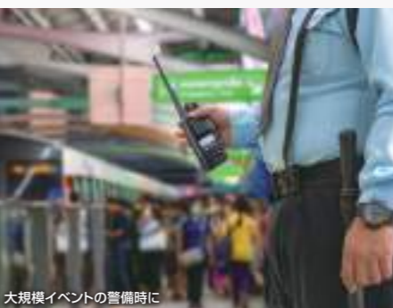
大規模イベントの警備時に

*1 バッテリーパック、アンテナ、保護カバーを正しく装着した状態で、試験用粉塵を1㎡あたり2kgの割合で浮遊させた中に8時間放置したのちに取り出して、無線機の内部に粉塵の浸入がないこと。また、水深1mの静水（常温の水道水）に静かに沈め、30分間放置したのちに取り出して、無線機として機能することです。また、一定の条件下における水滴や噴流、粉塵によっても無線機として機能することを表します。 *2 衝撃、振動、落下、低圧力など約20種類の試験を実施。