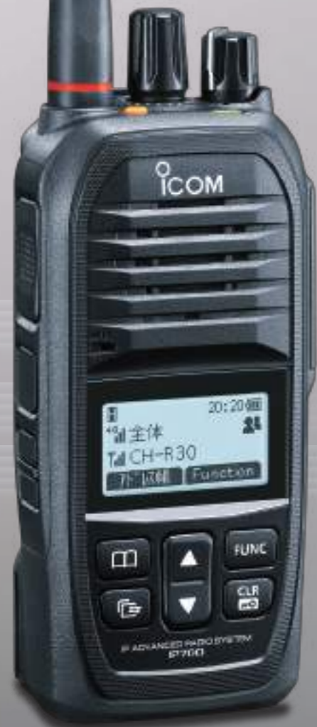
ハイブリッドIPトランシーバー