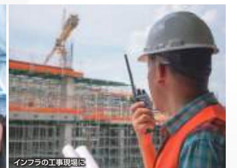
インフラの工事現場に