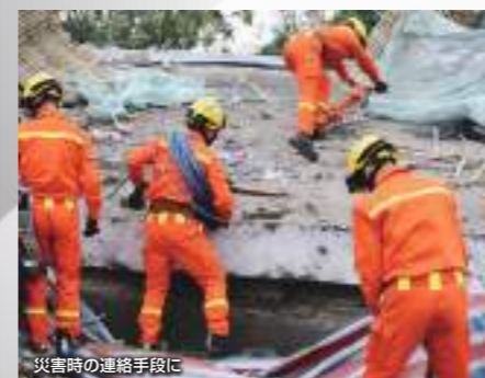
災害時の連絡手段に

短／長押しでそれぞれ機能を割り当てられるサイドキーを2つ装備しました。特定の相手や呼び出し方法を呼び出すワンタッチ機能、ユーザーコード切り替え、メッセージ選択、モニター機能を割り当てることができます。また、サブPTTスイッチにも同様の機能を割り当てることができます。