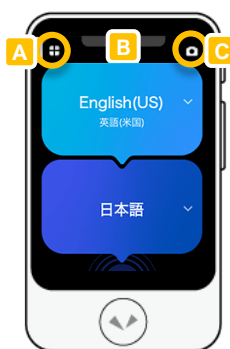
ホーム画面 (通訳画面)

画面左上にある 🍱 ランチャーから翻訳履歴、カメラ翻訳、単位変換などを選択できます。